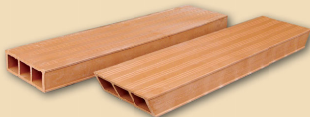
KMB HURDIS 1 rovné čelo